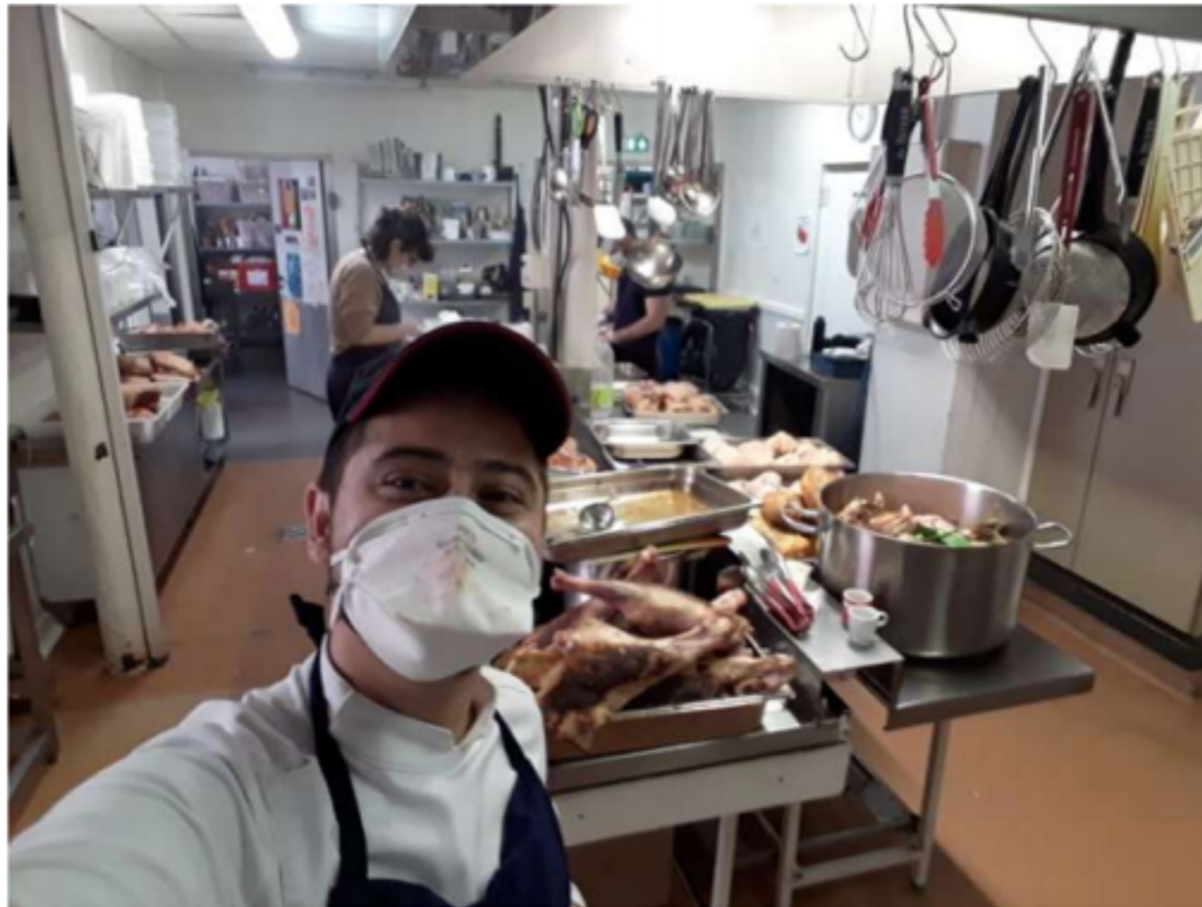
Aux Grands Voisins, se succèdent les cuisiniers de l'association Ernest et des chefs solidaires. Grands Voisins

Coronavirus : l'« effort de guerre » aux fourneaux pour aider les soignants et les sans-abri