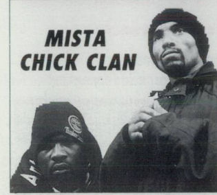
MISTA CHICK CLAN