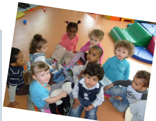
Là, ils sont sages... Ça ne va pas durer !!!

C'est un lieu d'éveil, de plaisir, de détente et d'autonomie pour tous les enfants et leurs parents !