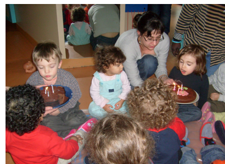
Joyeux anniversaire les enfants !!!