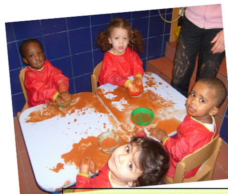
Trop chouette l'argile !!!