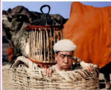
Fernandel dans Ali Baba et les 40 voleurs - Jacques Becker

Juché sur un âne, Ali Baba se rend en chantant au marché aux esclaves. A la demande du riche Cassim, son maître, il fait l'acquisition d'une danseuse, la belle Morgiane dont il s'éprend bien vite. Mais la caravane où a pris place le marchand est attaqué par les quarante voleurs commandés par le redoutable Abdul. Caché dans un panier, Ali Baba est emmené devant la caverne où les voleurs entassent leurs butins... En prononçant à son tour "Sésame ouvre-toi", Ali Baba, maître du trésor va pouvoir racheter la belle esclave...