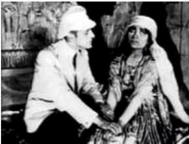
Photo : Pola Negri, Emil Jannings - Les yeux de la Momie - Ernst Lubitsch

Lors de sa sortie en 1918, ce film rencontre un énorme succès auprès d'un public occidental friand d'aventures orientalistes... Pola Negri, incarne cet idéal féminin, exotique, forcément tentateur dans un décor de péplum fantastico-érotique. L'intrigue de ce drame peut sembler vieillie, mais le récit diffuse son attraction dans une Egypte réinventée avec une splendeur inégalée. Lorsque Pola Negri danse, ses sensuelles contorsions forment le sujet du film, monde secret où les désirs inavoués éclatent.