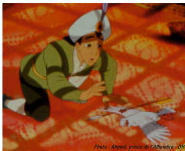
Photo : Ahmed, prince de l'Alhambra