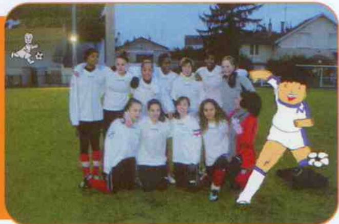
L'équipe féminine d'EGDO.

Nouveauté : Cette année signe également le retour de l'équipe senior.