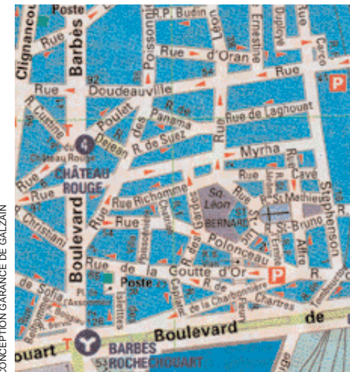
CONCEPTION GARANCE DE GALZAIN