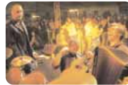
Le Bal des Martine