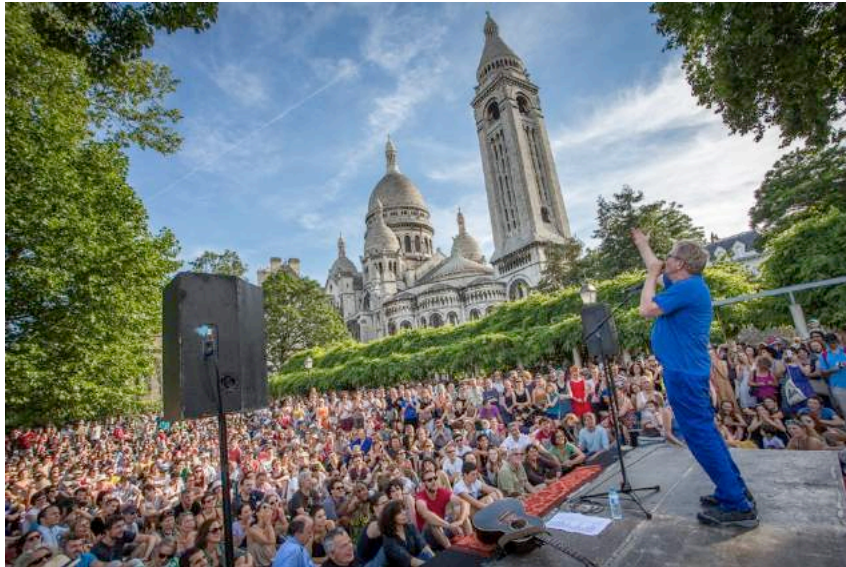
Concert Dick Annegarn au Parc de la Turler/Bleustein-Blanchet - RHIZOMES 2015