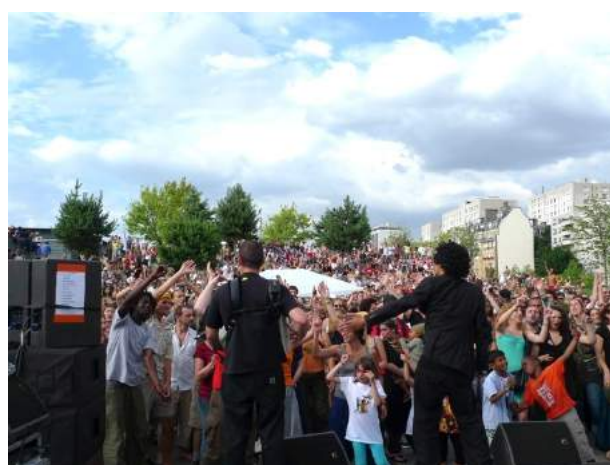
M.A.P. aux Jardins d'Éole