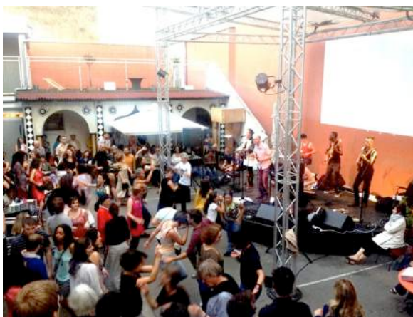
Le Bal à Bistan à l'Institut des Cultures d'Islam

Ce rapport original entre citoyens, artistes et urbanisme a accru le public et la couverture médiatique de manière impressionnante (voir chiffres et revue de presse). Depuis 2004 , l'accueil a toujours été chaleureux voire euphorique sur l'ensemble de la manifestation et aucun incident ne s'y est jamais produit .