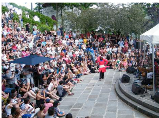
Ny Malagasy Orkestra aux Arènes de Montmartre

Les actions menées avec l'ICI, l'Hôpital Bretonneau, le Centre Musical Fleury Goutte d'Or-Barbara et la Goutte d'Or en fête ont permis de poursuivre la politique de coopération menée depuis plusieurs années par le festival, qui fait ainsi partages de son label d'excellence artistique et de son public diversifié avec des acteurs plus que jamais demandeurs.