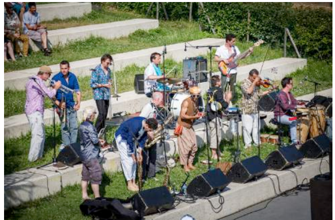
Fanfarai aux Jardins d'Eole – 5 juillet 2015