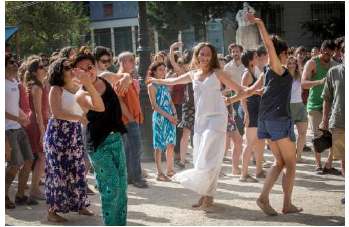
Yom au square Carpeaux – 28 juin 2015