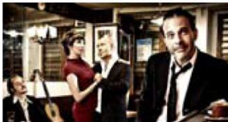
Padam, en concert dominical et juilletiste lors du Festival Rhizomes.

Cette année, le parcours nous déracine des squares du 18 e arrondissement aux extérieurs de l'Hôpital Bretonneau, des Jardins d'Eole de Stalingrad au Canal de l'Ourcq en passant par les Arènes de Montmartre. Là, on y croisera la