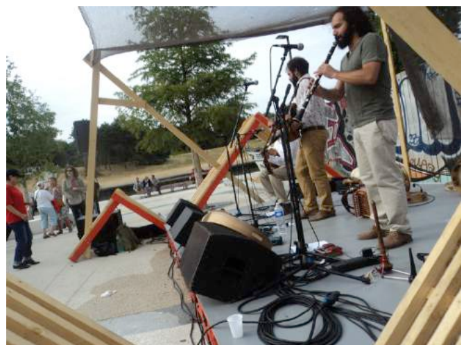
Télamuré sur la station fluviale de Bellastock – 12 juillet 2015