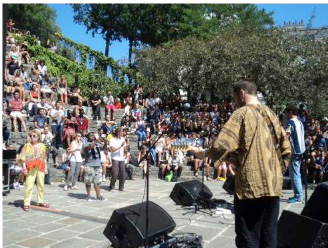
Global Gnawa aux Arènes de Montmartre – 11 juillet 2015