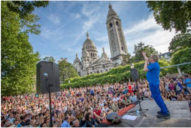
Dick Annegarn au Parc de la Turlure/Bleustein-Blanchet – 27 juin 2015